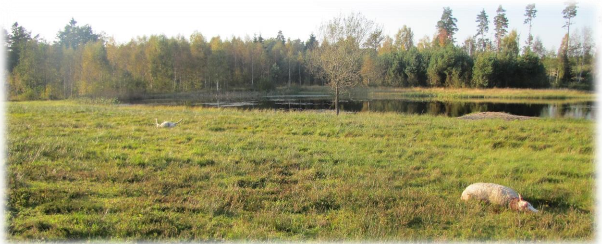
Vargdödade får.

Läs bifogade dokument: Jägareförbundets jurist om paragraf 28 samt Varg får skjutas i nödvärn.