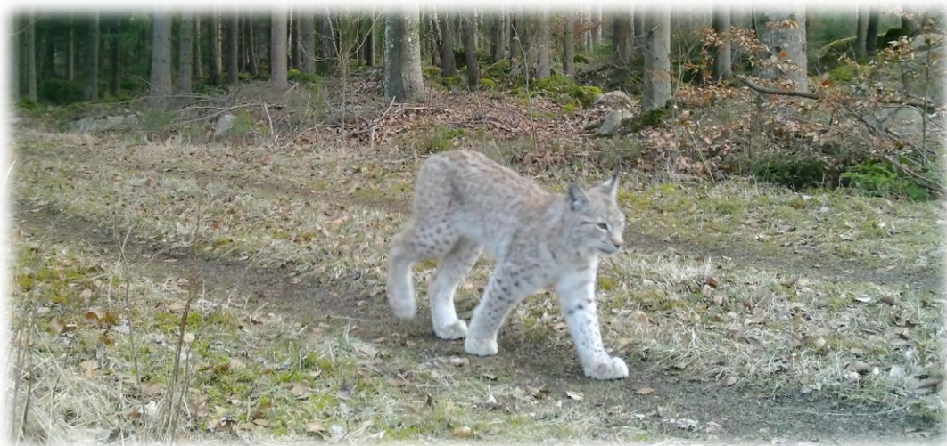
Lodjur på väg.

Så en uppmaning är att faktiskt ta till sig kunskap om rovdjurens biologi och aktuella frågor i förvaltningen samt spår och rörelsemönster. Ju mer vi vet desto bättre är det för alla inblandade. Det är också viktigt att sätta sig in i hur förvaltningssystemet fungerar eller åtminstone är tänkt att fungera. För det finns verkligen förbättringspotential i systemet, inte minst kopplat till vargen.