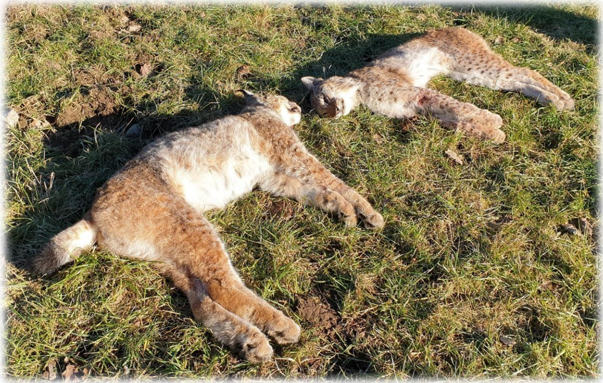
Licensjakten 2021.