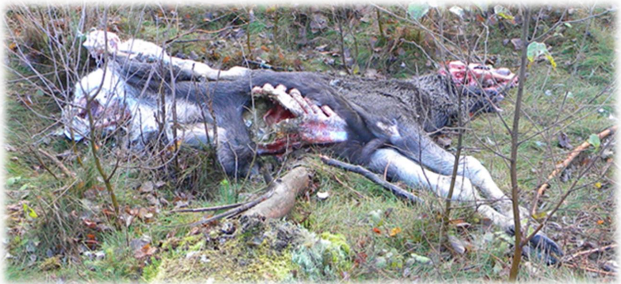
Vargdödad älgkalv.

Även tamdjurhållningen blir kraftigt försvårad och stora problem kan uppstå.